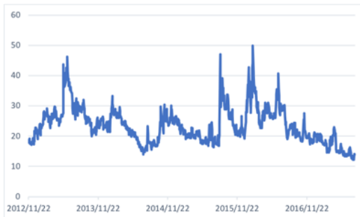
図 2 VI 指数