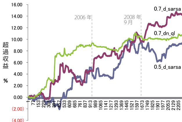
図 2: 累積超過収益率

れた価値が広く伝播するため、 \lambda 0.9\_d\_sarsa は、リーマン・ショックのような負に大きな影響が急速に伝播することで、累積報酬が2008年9月頃から急に減少していると考えられる。